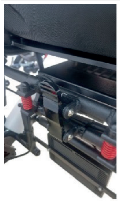
Pestillo cierre (Låsemekanisme)